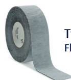
Tyvek® FlexWrap tape