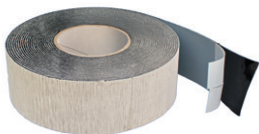
Lengte: 10 m Breedte: 60 mm