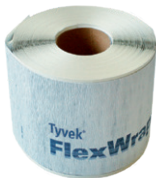
Lengte: 23 m Breedte: 15 cm

Flexibele, hoogperformante tapes voor luchtdichte en waterdichte afdichtingen rond daken, plafonds en muurpenetraties